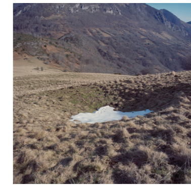
Col de Marty, Sentein

Ake vient de s'inscrire pour la première fois à Pôle emploi.