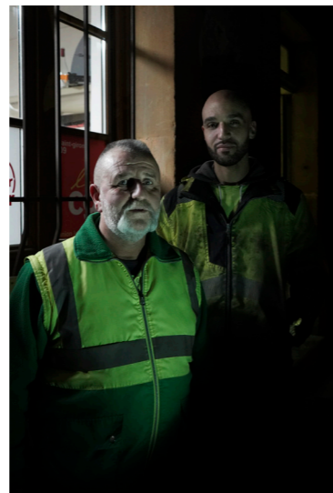
Les grévistes de Saica nature, Union Locale de la CGT, Saint-Girons