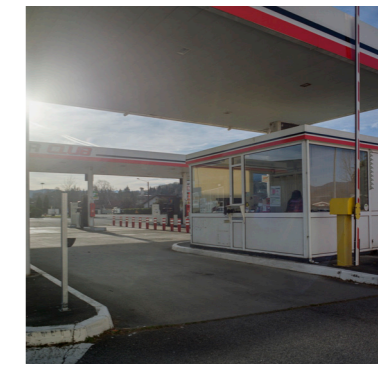
Le bureau des pompistes d'Intermarché, Saint-Lizier