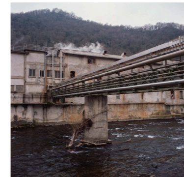
Papeterie la Moulasse, Eycheil