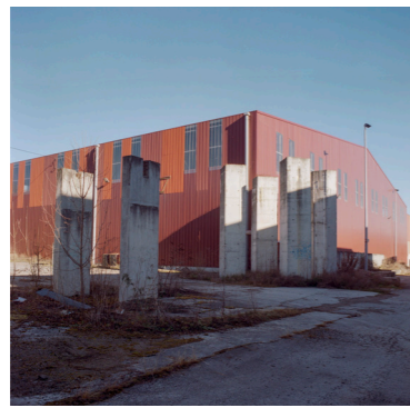
Papeterie Ledar, Saint-Girons