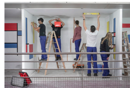
Les jeunes de la classe 3eme prépa métier (2023-24), Lycée Aristide Bergès, Saint-Girons