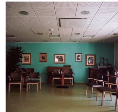
EHPAD Paul Ané, Seix