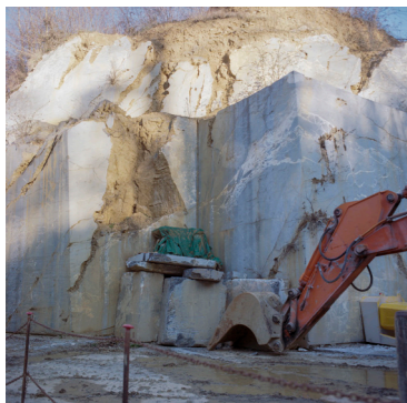
La marbrière Grand Antique, Moulis

Gregory a été accompagné par Pôle emploi pour travailler comme chauffeur poids lourds. Il a passé tous les permis, mais ne parvient pas à être embauché car il n'a pas d'expérience dans la profession. Pas même pour un stage. Il s'est récemment fait radié de Pôle emploi car il n'a pas répondu à trois offres qui ne correspondaient pourtant pas à son profil.