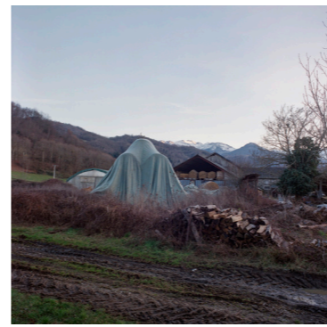
Une ferme, Audressein